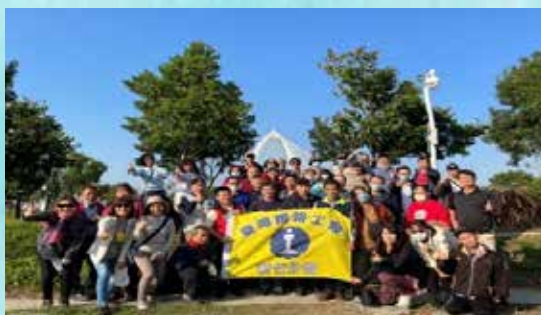
新竹分會舉辦員眷秋季旅遊埔里-奧萬大森林區二日遊