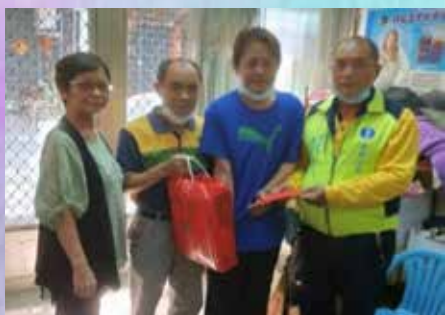
屏東分會吳理事長慰問因公受傷會員並致送慰問金