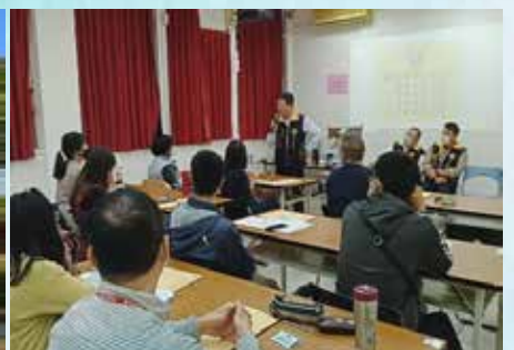
臺中分會辦理110年新進會員教育訓練