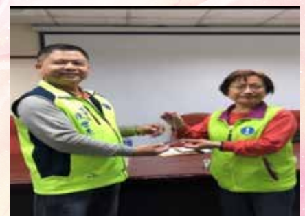
召開本屆第10次常務理事會議 暨致贈會務人員榮退紀念品