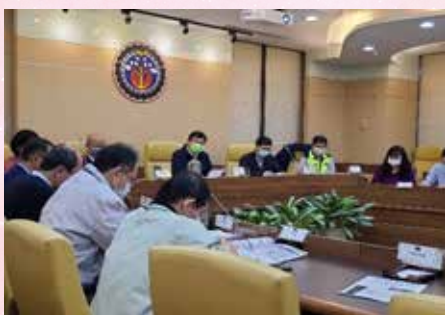
理事長率領幹部出席交通部 臺鐵轉型改革諮詢會議